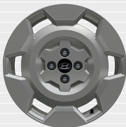
Vertex® Cross 17" Leichtmetallfelgen 205/45 R17