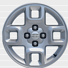
Amplia® 15" Leichtmetallfelgen 185/65 R15