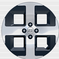
Vertex® 17" Leichtmetallfelgen 205/45 R17