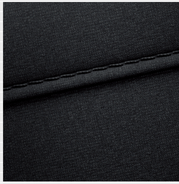
Amplia®, Vertex® Sitze in schwarzem Stoff