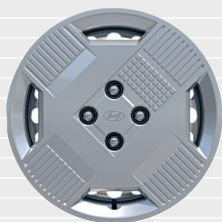
Pica® / Origo® 15" Stahlfelgen mit Radzierblenden 185/65 R15